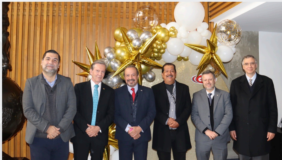
Comida de fin de año Oficinas Centrales 14 de diciembre