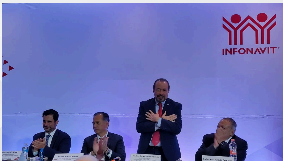
128 Asamblea General de Infonavit 14 de diciembre